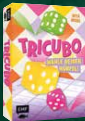
Würfelspiel: Tricubo – Wähle deinen Würfel!