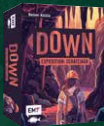
Down – Expedition: Schatzjagd