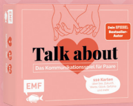
Talk about – Das Kommunikationsspiel für Paare GTIN 4260478341531