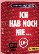
Ich hab noch nie ... – Ü18 GTIN 4260478343337