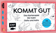
Kommt gut – Das Kartenspiel für mehr Oohs und Aahs GTIN 4260478341883